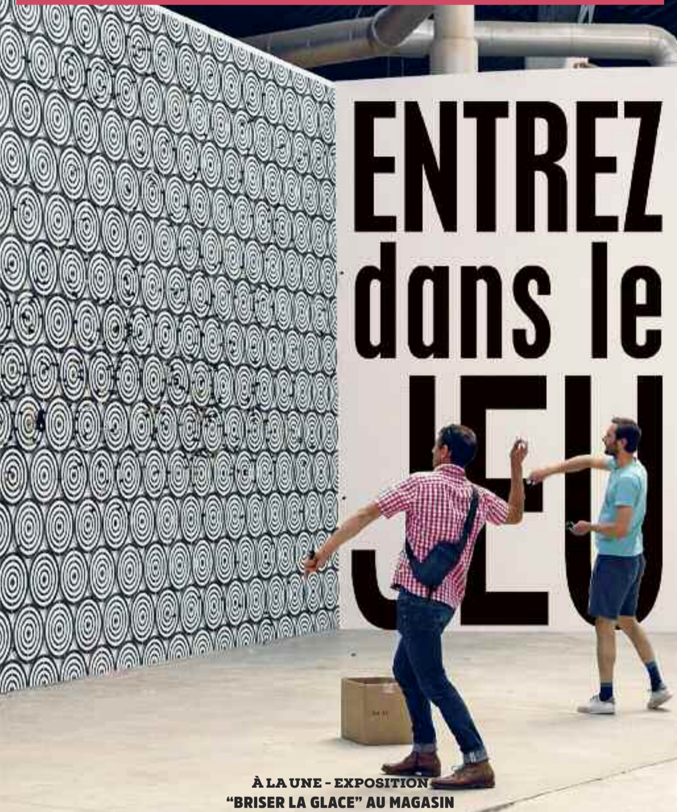
À LA UNE - EXPOSITION "BRISER LA GLACE" AU MAGASIN